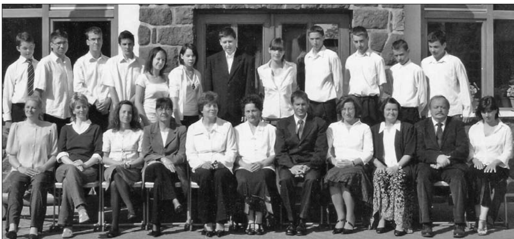
A 2007-2008-as tanévben végeztek 8/a.osztály

A részletekről Alsóörsön a római katolikus templomban lehet érdeklődni.