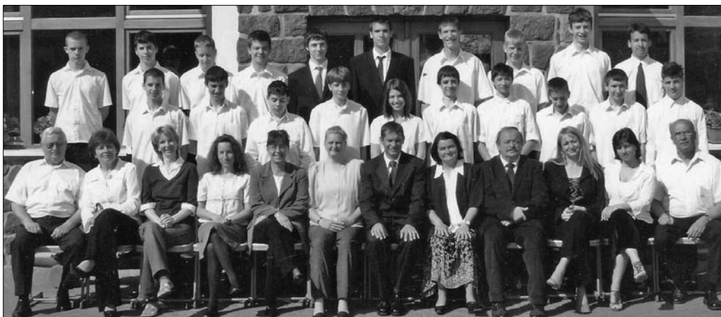
A 2007-2008-as tanévben végeztek 8/b. osztály